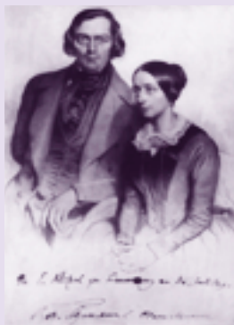
Robert und Clara Schumann

• Robert-Schumann-Gesellschaft • Frankfurt am Main e.V.